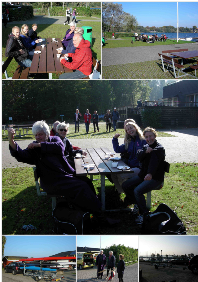
. Støt Brysterne 2010